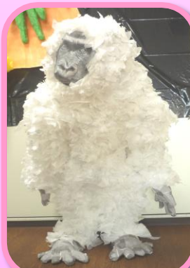
雪山に突如現れた 大男の正体に迫る... ツチノコ復活計画...