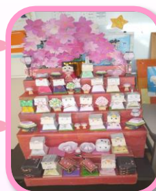
ペーパークラフト鑑