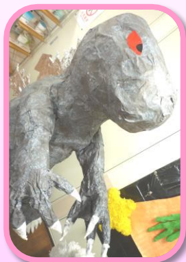
東DCにゴジラ出現!! 八戸に伝わる河童伝説...