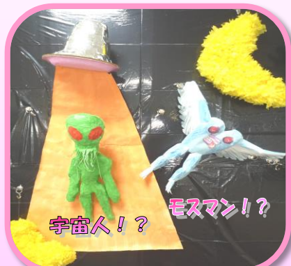
※モスマンとはアメリカのUMAで蛾人間のこと