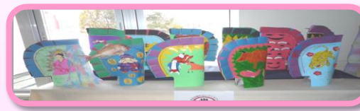
普通サイズ烏帽子